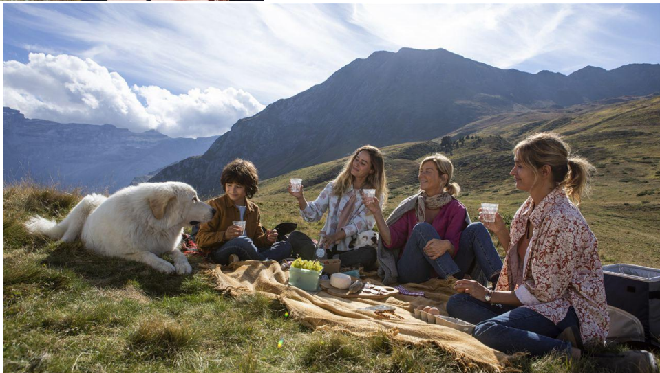
La famille réunie avec Belle